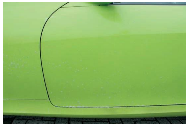
Reinigen Sie den Wagen mit einem guten Autoshampoo und spülen Sie ihn mit Wasser ab

Eine Kombination mit anderen Reinigungsprodukten ist nicht erforderlich, sodaß das Material für den Benutzer nicht irritierend ist.