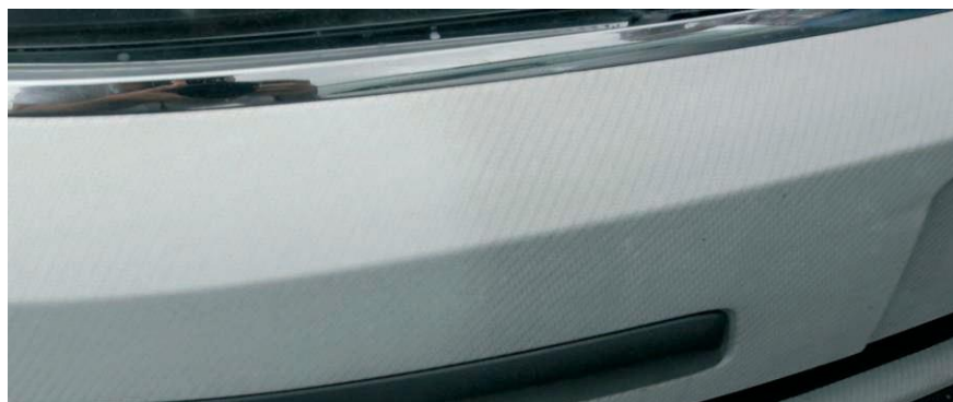
Links, Resultat nach Reinigung – Rechts, Situation vor Reinigung

Vor allem die weißen Carbonfolien sind sehr Schmutzempfindlich. Nicht nur weil sie weiß sind, sondern auch wegen ihrer Struktur. Auf dem Foto sehen Sie eine Stoßstange die vor 15 Monaten mit weißem Carbon verklebt wurde, und nachher regelmäßig in der Waschstraße gereinigt wurde. Trotz der regelmäßigen Reinigung mit alltäglichem Autoschampoo ist der Schmutz tief in den mikroskopischen Löchern der Folie eingedrungen.