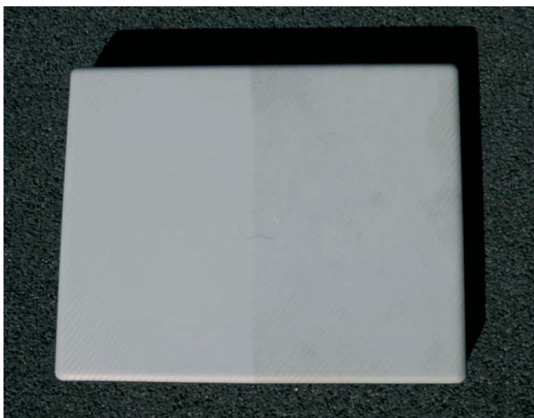
Links, Resultat nach Reinigung – Rechts, Situation vor Reinigung

Auch ein Ofen- & Kaminscheibenreiniger ist ein sehr gutes Produkt für die Reinigung weißer Carbonfolien.